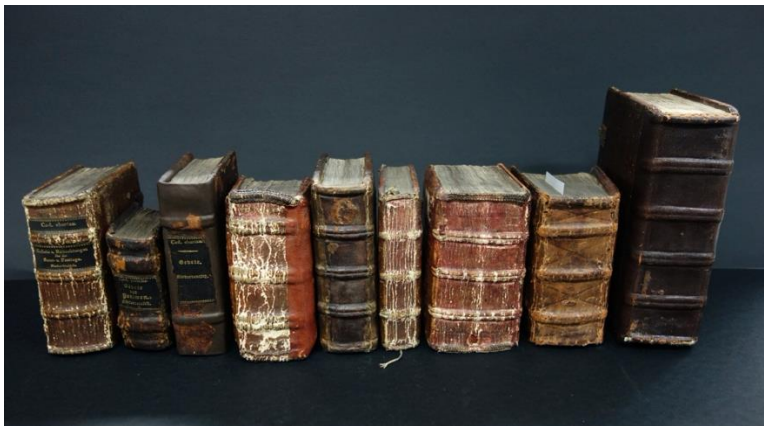
Ausschnitte aus dem Bestand von Cod. conv. 1-14. Bild: SUB

Voltmann, Niklas, „As if in Purgatory“: Death by Disease in a 15th-Century German Ars moriendi (erscheint voraussichtlich 2025 in Archa Verbi. Subsidia 24)