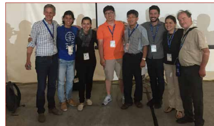
Workshop zur Kriegsdienstverweigerung mit Vertretern aus Kolumbien, Südkorea und Südafrika.

Die ATF war mit mehreren Workshops an der diesjährigen Vollversammlung der Mennonitischen Weltkonferenz in den USA beteiligt, vor allem zu Themen der aktuellen Ökumene. Gemeinsam mit Experten aus Kolumbien, Südkorea und Südafrika sowie mit Kriegsdienstverweigerern aus diesen Ländern wurde von der ATF das Thema der Kriegsdienstverweigerung als allgemeines Menschenrecht bearbeitet.